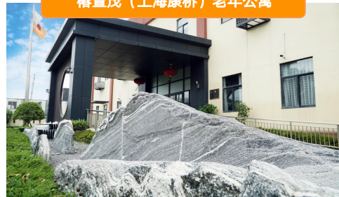
椿萱茂（上海康桥）老年公寓