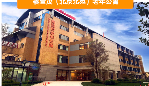
椿萱茂（北京北苑）老年公寓