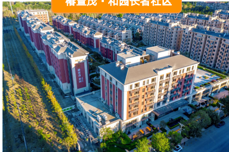
椿萱茂·和园长者社区