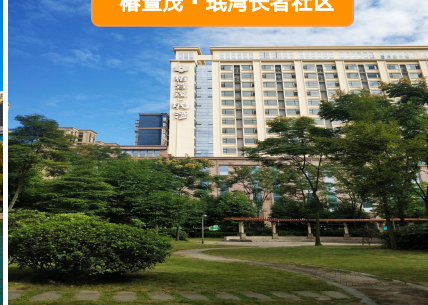
椿萱茂·璞湾长者社区