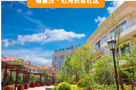
椿萱茂·虹湾长者社区