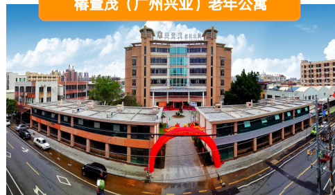
椿萱茂（广州兴业）老年公寓