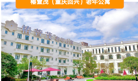
椿萱茂（重庆回兴）老年公寓