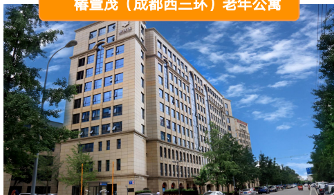
椿萱茂（成都西三环）老年公寓