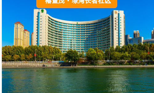
椿萱茂·瓊湾长者社区