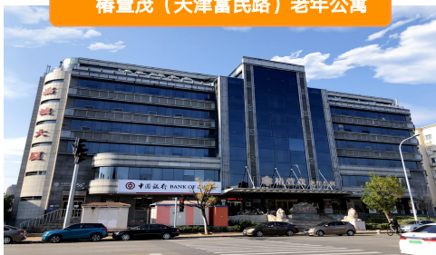
椿萱茂（天津富民路）老年公寓